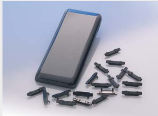
Battery Cover mit Side Keys