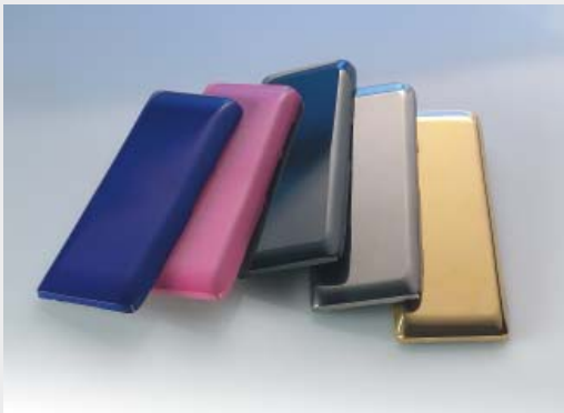
Battery Cover in verschiedenen Farben

Als Systemanbieter von Baugruppen mit Kunststoffen bietet Ihnen OECHSLER weitere Vorzüge. Wir integrieren spritzgegossene Keramiken/Metalle auch mittels manueller, teil- und vollautomatischer Montageprozesse in komplexe Baugruppen. Hierfür erforderliche Präzisionskunststoffteile können wir dabei bei Bedarf aus weiteren Sonderverfahren der Spritzgießtechnik wie Mikro- oder Magnetspritzguss, IMD-Technik, MID-Technik, Mehr-K-Technik und Montagespritzguss fertigen.