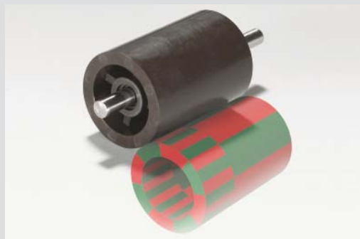
Rotor mit drei integrierten Magnetspuren

Auch in Sachen Werkzeugtechnik spielt OECHSLER ganz vorne mit. Zusammen mit Hochschulen und Partnerunternehmen arbeiten wir an neuen Werkzeugkonzepten mit integrierten Magnetrichtfeldern – Beispiele dafür, wie wir die Entwicklung von Magneten mit komplexen Geometrien und Magnetisierungsmustern durch Forschen voranbringen.