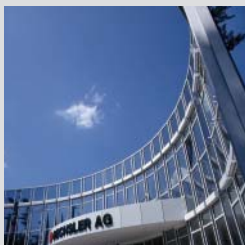
Firmenzentrale in Ansbach